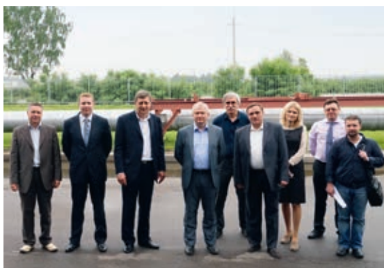
Делегация ОАО «Мосэнерго» на заводе компании «ИЗОЛЯТОР»

В середине 2013 г. делегация ОАО «Мосэнерго» посетила завод компании «ИЗОЛЯТОР», где обсуждалось развитие партнерства. В августе 2013 г. Теплоэлектроцентраль №22 — филиал ОАО «Мосэнерго», выразила благодарность компании «ИЗОЛЯТОР» за оперативную помощь и профессиональную работу. В ноябре 2013 г. «Мосэнерго» и «ИЗОЛЯТОР» подписали соглашение о намерениях, и мы готовы приложить все усилия для успешного развития наших отношений.