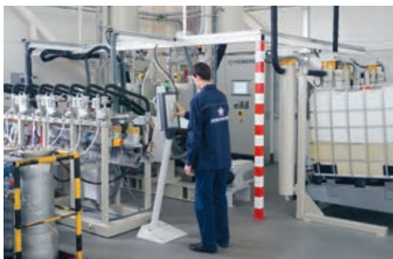
Установка Hübers 270300. Программирование параметров процесса заливки

Установка осуществляет непрерывное приготовление электроизоляционного эпоксидного компаунда в точном соответствии с заданным соотношением исходных компонентов.