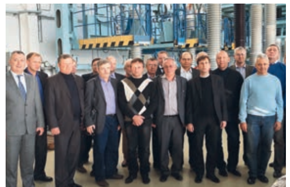
Делегация концерна «Росэнергоатом» в сборочном цехе завода компании «ИЗОЛЯТОР»

Компания «ИЗОЛЯТОР» искренне благодарит организаторов, а также всех участников семинара за визит.