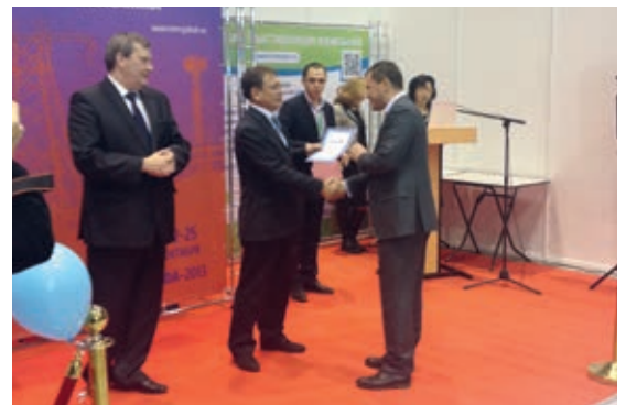
Награждение компании «Изолятор» на Российском энергетическом форуме в Уфе

Компания «ИЗОЛЯТОР» была награждена дипломом за активное участие и профессионализм, а также дипломом за оригинальное оформление выставочного стенда.