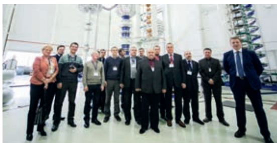
Делегация МРСК Северо-Запада в испытательном центре завода компании «ИЗОЛЯТОР»

Непосредственно на данной выставке были проведены переговоры с ОАО «ФСК ЕЭС», ООО «Эльмаш» (УЭТМ), а также с рядом других партнеров и потребителей энергетического рынка РФ и ближнего зарубежья.