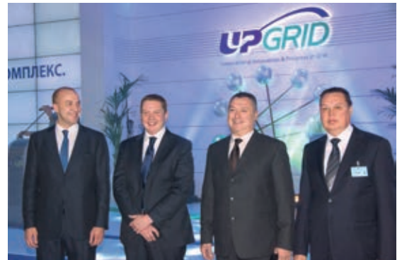
Представители компании «ИЗОЛЯТОР» на Международном электроэнергетическом форуме UPGrid 2013 в Москве

Компания «ИЗОЛЯТОР» приняла участие в Международном электроэнергетическом форуме UPGrid 2013 «Электросетевой комплекс. Инновации. Развитие», прошедшем в Москве. Главным результатом участия в форуме — возможность непосредственного общения с большим количеством потребителей продукции с наглядной демонстрацией собственных технологических достижений.