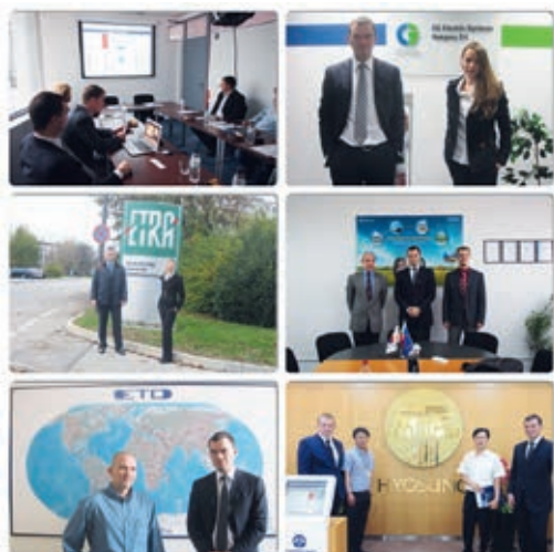
Мировое деловое турне

Благодарим ОАО «РусГидро» за приглашение, а также за продуктивное обсуждение технических аспектов и вопросов развития сотрудничества.